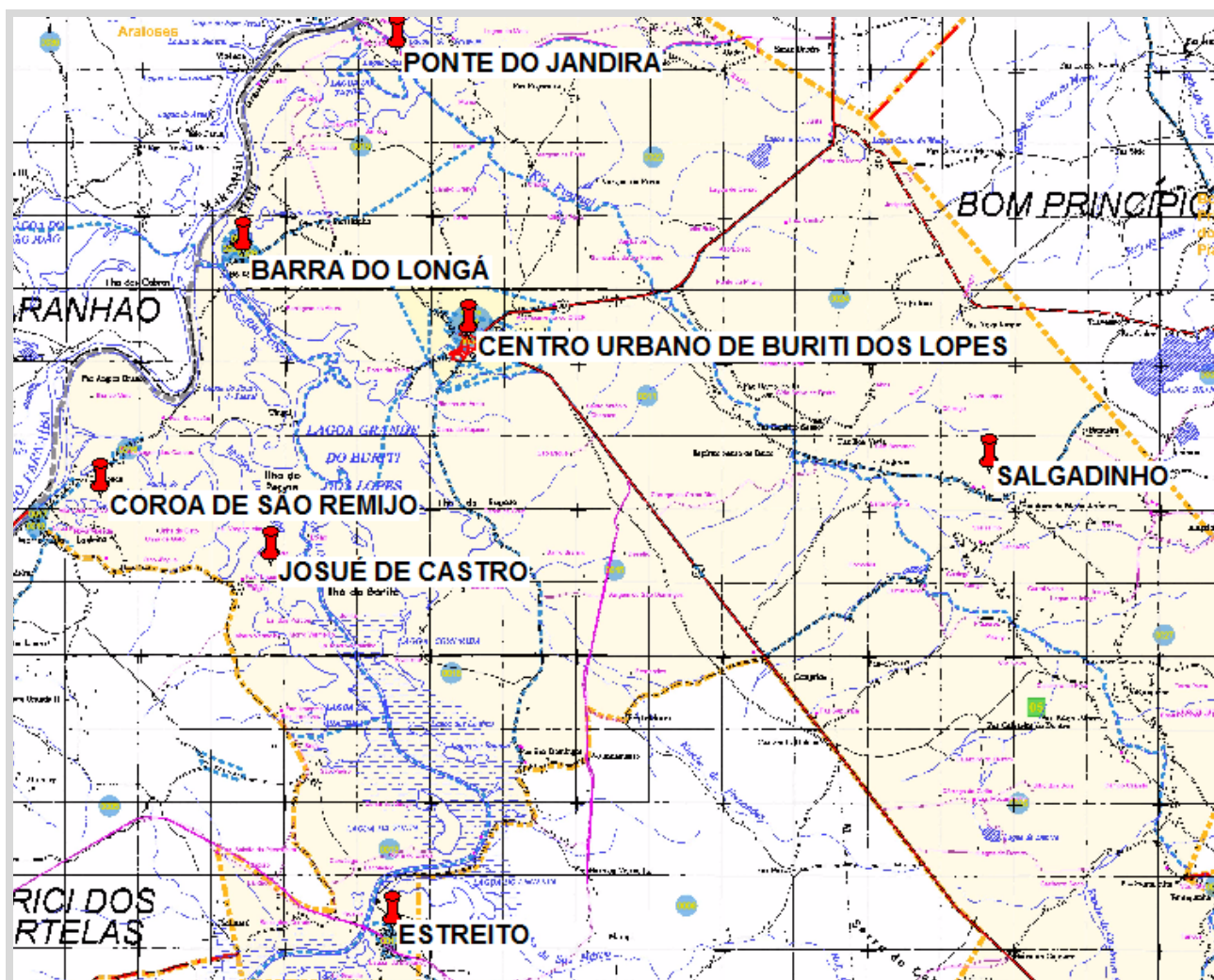
Figura 2 - Trecho do Mapa de Buriti dos Lopes, com destaque para as comunidades estudadas.

Assim, através de atividades realizadas no município entre janeiro e fevereiro de 2014, houve a possibilidade de desenvolver este estudo, em seis comunidades rurais e o centro urbano de Buriti dos Lopes; procurou-se avaliar a qualidade da água frente aos valores de condutividade elétrica, à composição geológica, às formas de captação e às atividades econômicas predominantes no entorno. (Figura 2).