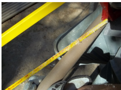
Figura 3.2 - "Cegueta" (serra manual) para confecção das ranhuras