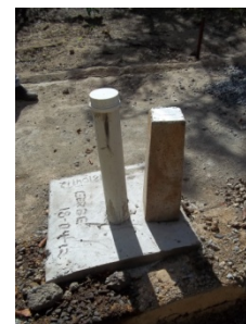
Figura 3.4 - Cimentação e laje sanitária em poço implantado