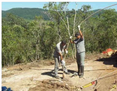
Figura 3.3 - Descida da coluna de revestimento