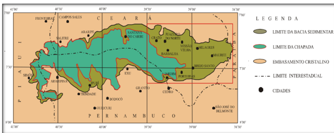
Figura 01 – Localização da Bacia do Araripe (adaptado de CPRM, 2005).

A partir destes poços foram construídas adutoras, beneficiando cinco municípios no Ceará e em Pernambuco, abastecendo mais de 100.000 habitantes (figura 02).