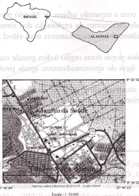
Figura 01 - Mapa de localização da área de estudo

O restante da área estudada faz parte do Tabuleiro do Martins, onde toda a água superficial provém das chuvas e escoam, geralmente, para as depressões naturais existentes na área ou para as lagoas de acumulação escavadas com a finalidade de atenuar as cheias, muito comuns na região.